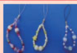
紫外線ビーズストラップ

【参加対象】どなたでも 【参加費】各100円 【内容】~4月15日(日)パステルプラ板ストラップ ~4月30日(月)ラメ入りスライム ~5月 6日(日)すっ飛びロケット ~6月 3日(日)紫外線ビーズストラップ ~6月24日(日)アンモナイトレプリカ