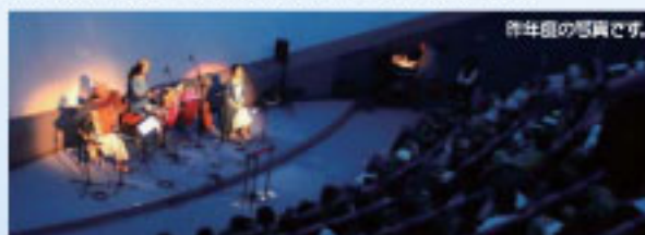
作井組の演奏です。