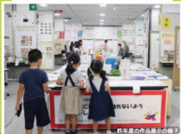
昨年度の作品展示の様子